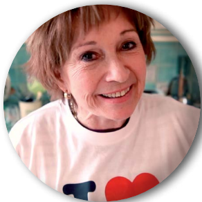
Marion Game (Scènes de Ménage sur M6)