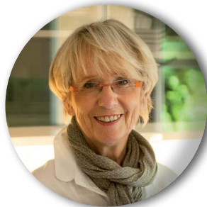
Mercotte (Le meilleur pâtissier sur M6)